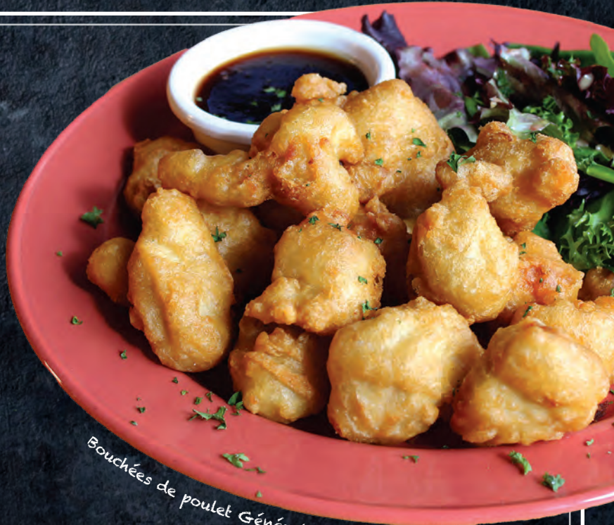
Bouchées de poulet Général Tao