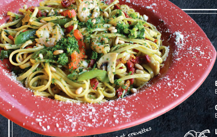
Pâtes linguines pesto, légumes et crevettes